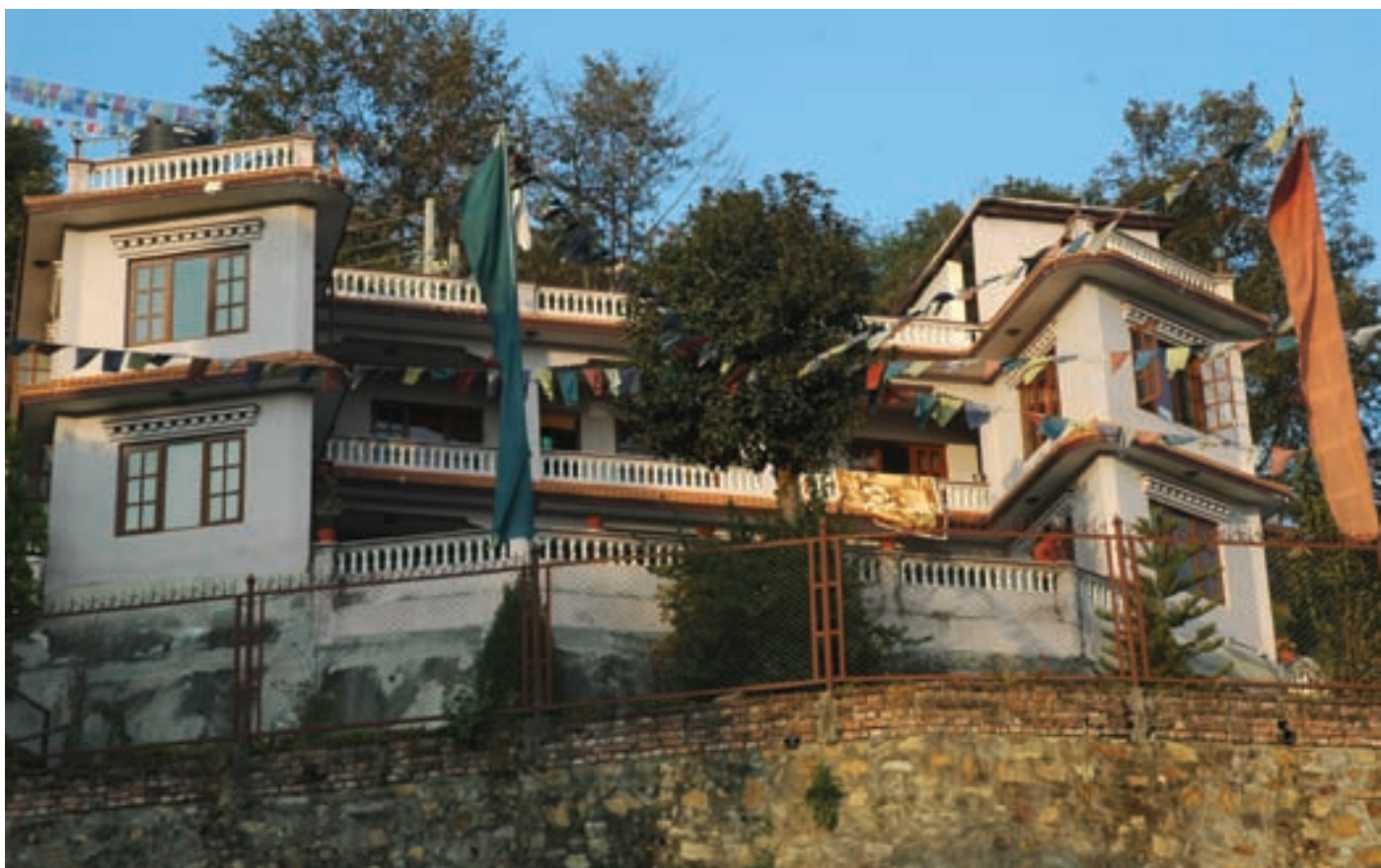
De muur om het Kopan-huis toen deze nog overeind stond.

Na telefonisch overleg met Lama Wangyal werd het besluit genomen dat de reparatie onmiddellijk zou worden >>>